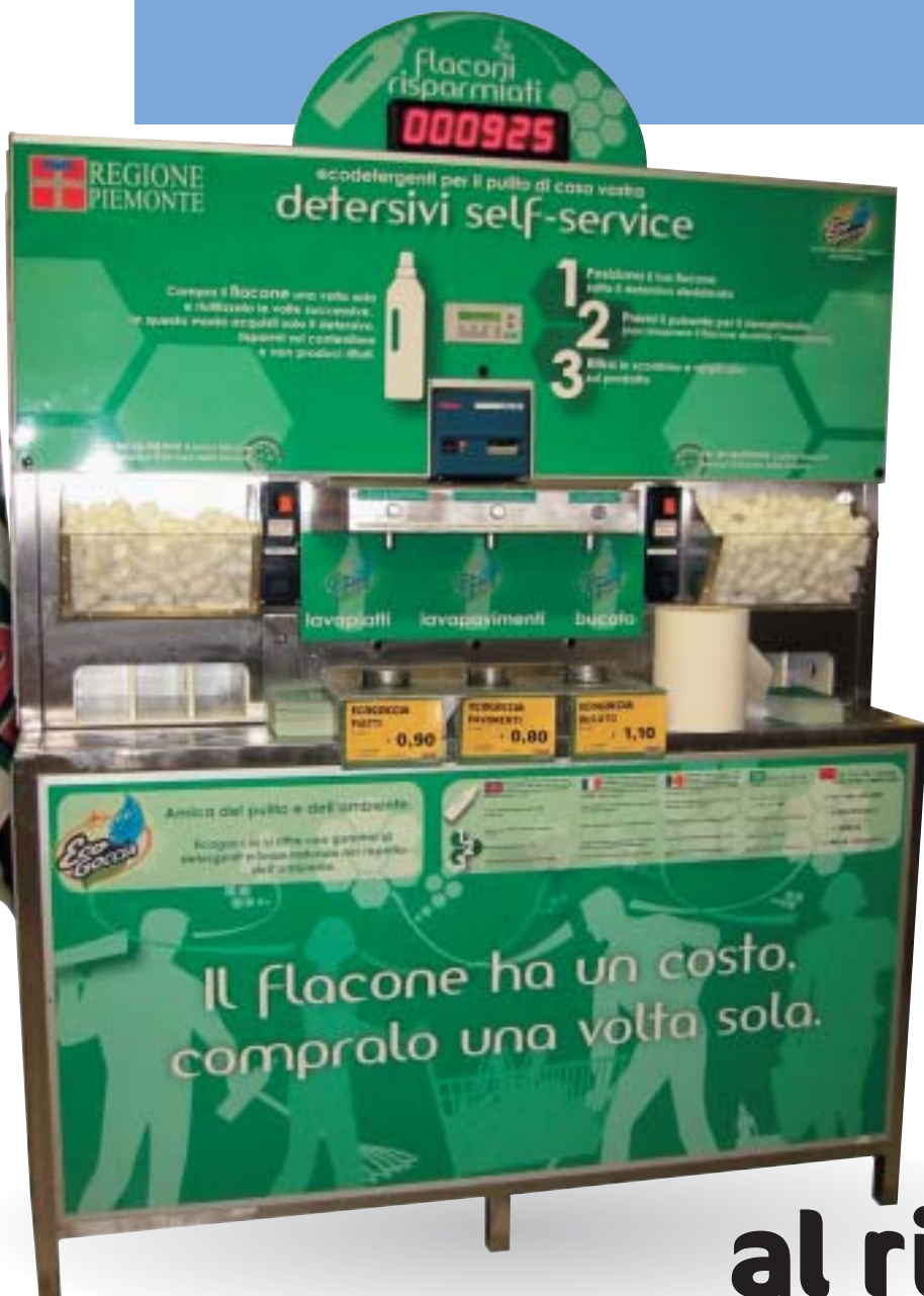
La macchina erogatrice dei detersivi ecologici "alla spina".

Aderendo al "Progetto Riduzione Rifiuti nella Grande Distribuzione Organizzata" promosso dall'assessorato all'ambiente della Regione Piemonte, Crai arricchisce con un'importante novità la propria offerta di prodotti "senza sprechi".